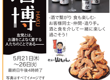
写真はすべてイメージです