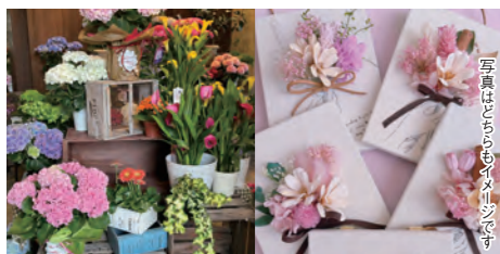
写真はどちらもイメージです

お母さんへ「ありがとう」を贈る母の日。暮らしにやさしく寄り添うグリーンと、心がほっとする雑貨を集めました。日頃の感謝を、癒しのギフトとともに届けてみませんか。