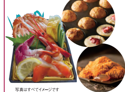
写真はすべてイメージです