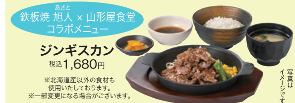
写真はすべてイメージです

山形屋(鹿児島)ヤマカタヤカードカウンターは 2025年12月31日(水)をもちまして業務を終了させていただきます。(ヤマカタヤカードにつきましては引き続きご利用いただけます。)