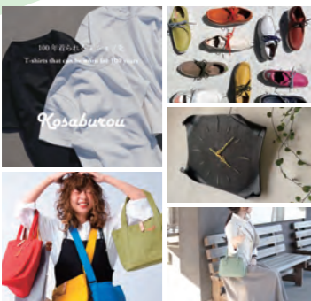
写真はすべてイメージです

「良いものを、正しく、魅力的に伝える」「世界に一つしかない、「あなたらしい」を日本から」をコンセプトに、背景・技術・ストーリーを重視した編集型プロジェクトです。