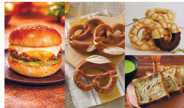
写真はすべてイメージです

みんな大好き!種類豊富なパンが大集合♡パンと合わせて楽しめるスイーツや、毎日、日替わりで人気のパン屋さんも登場いたします!