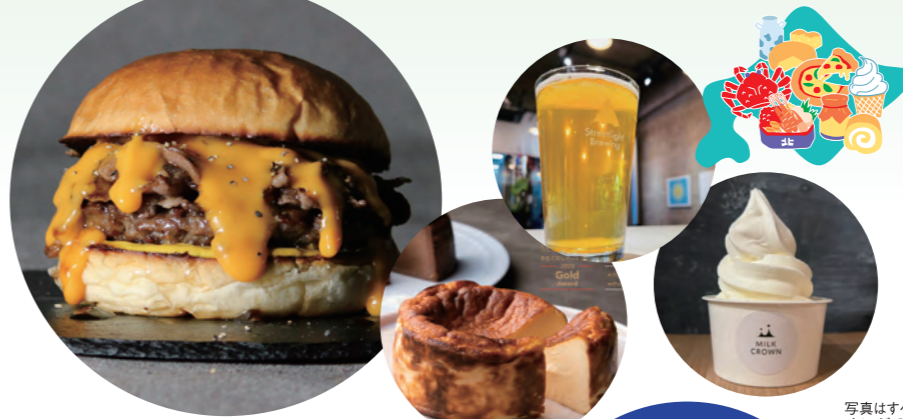
写真はすべてイメージです