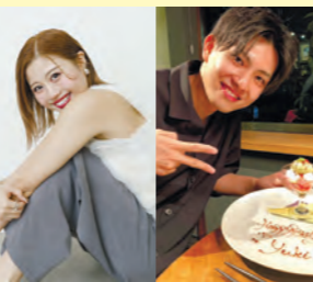
写真はどちらもイメージです

インフルエンサーマリア @mariyummy_ ポポの休日/鹿児島グルメ・観光 @popo_kyushu の厳選するお店が大集合!!