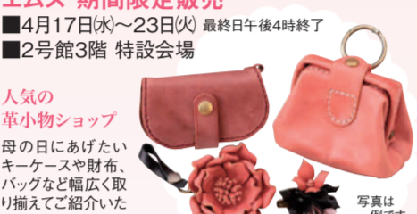
人気の草小物ショップ