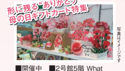
形に残る「ありがとう」 母の日ギフトカード特集