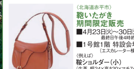
お買上げいただいた製品にはお名前入れサービス。

5月11日(土)・12日(日) お店お渡し 承り中 5月9日(木) 午後4時まで お渡し場所 フローリスト メルチェ(1号館1階)